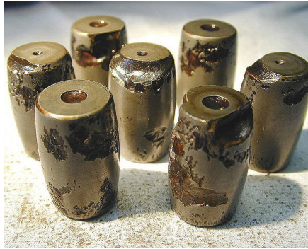
Ролики контрафактного сферического роликоподшипника

В случае установки на оборудовании, критически важном для обеспечения безопасности, поддельная продукция может представлять большой риск для здоровья людей и окружающей среды.